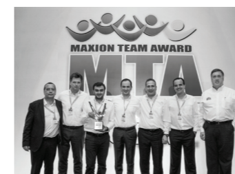
CENA MAXION TEAM AWARD ZA 1. MÍSTO, NATURAL WORK TEAM (NWT), KATEGORIE VÝROBY.