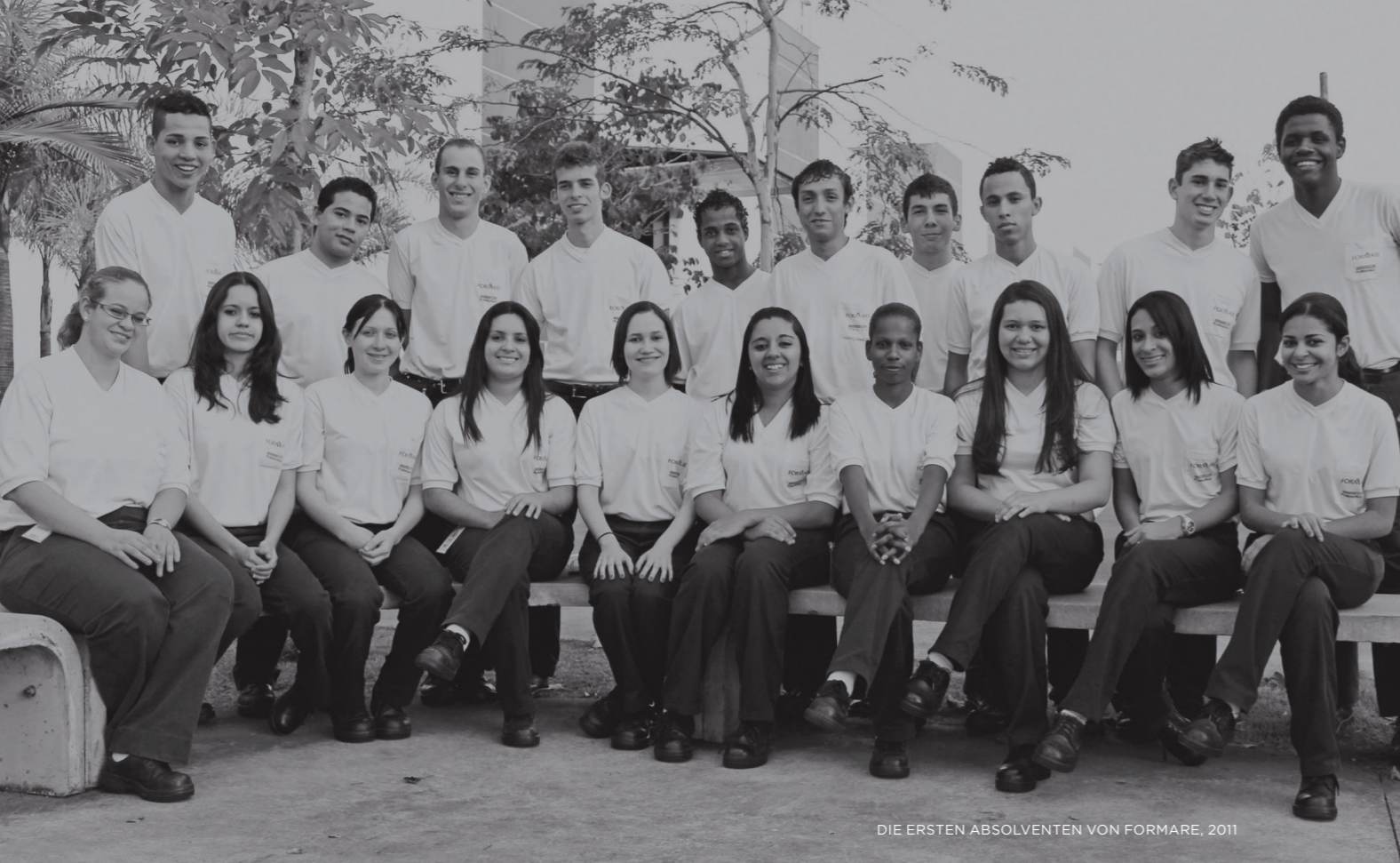
DIE ERSTEN ABSOLVENTEN VON FORMARE, 2011