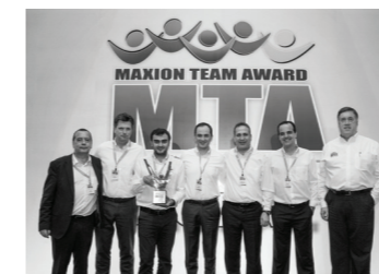
1. PLATZ BEIM MAXION TEAM AWARD, IN DER KATEGORIE "NATURAL WORK TEAM (NWT) PRODUCTION".