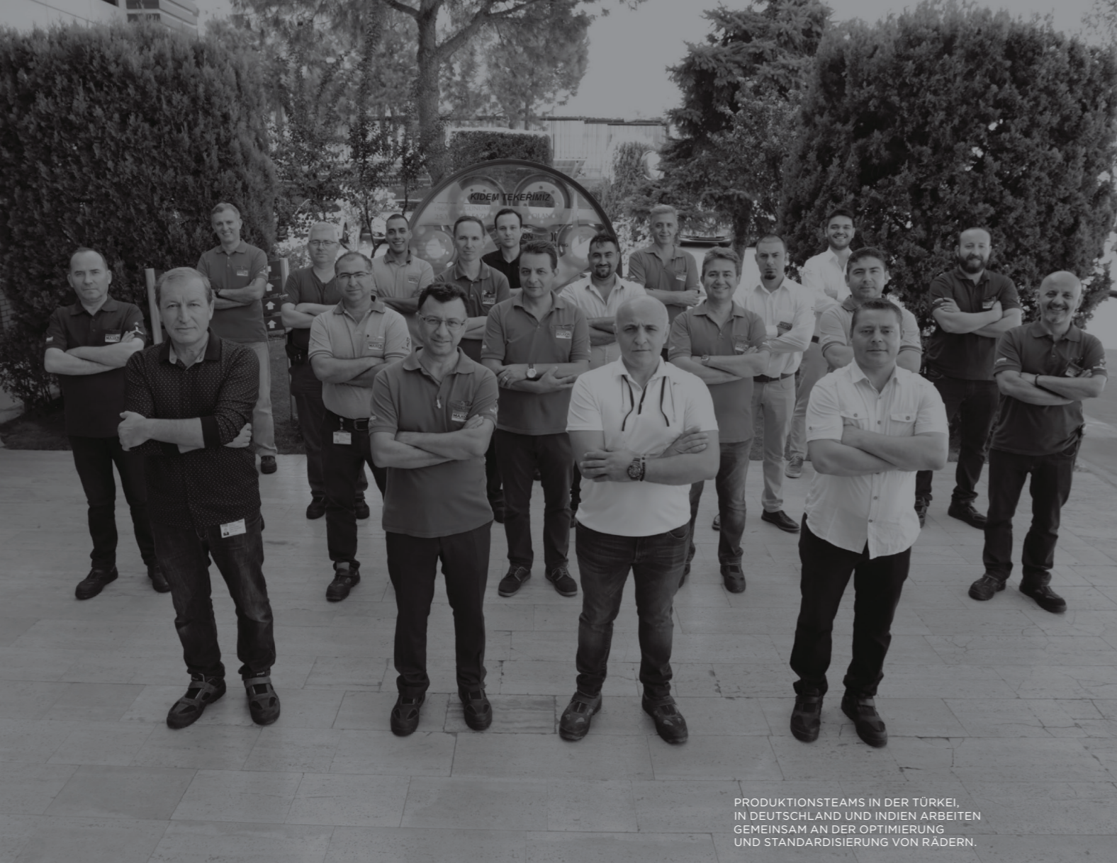
PRODUKTIONSTEAMS IN DER TÜRKEI, IN DEUTSCHLAND UND INDIEN ARBEITEN GEMEINSAM AN DER OPTIMIERUNG UND STANDARDISIERUNG VON RÄDERN.